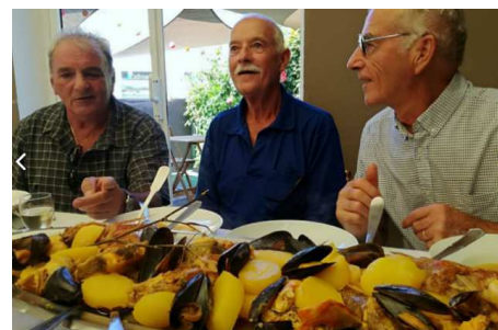
Île des Embiez

Le vendredi après-midi à partir de 14 h, selon