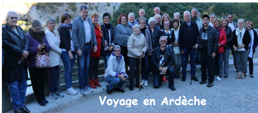
Voyage en Ardèche

Vous poursuivons notre partenariat avec le Club de l' Edelweiss de Turriers. Notamment le repas de la chèvre à l' automne dans le Champsaur, les concours de boules ainsi que les voyages