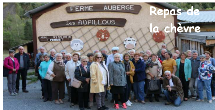
Repas de la chèvre